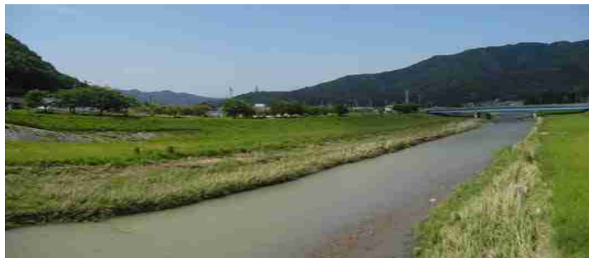
柳橋より南側 分水嶺の北 市島町を北から南へ流れ下る由良川水系竹田川 柳橋より北側 丹波市市島町柳橋で 2011.5.14.