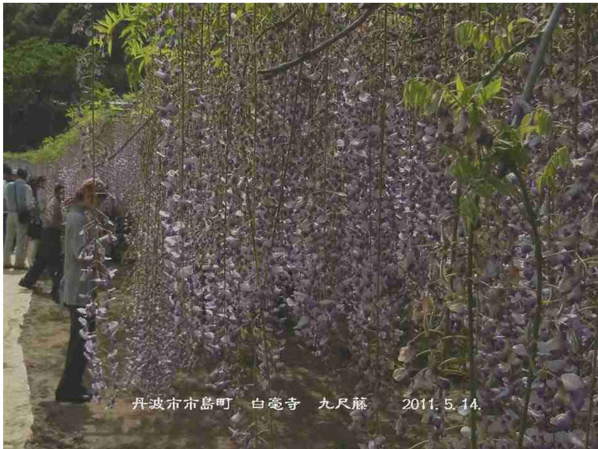
丹波市市島町 白毫寺 九尺藤 2011. 5. 14.