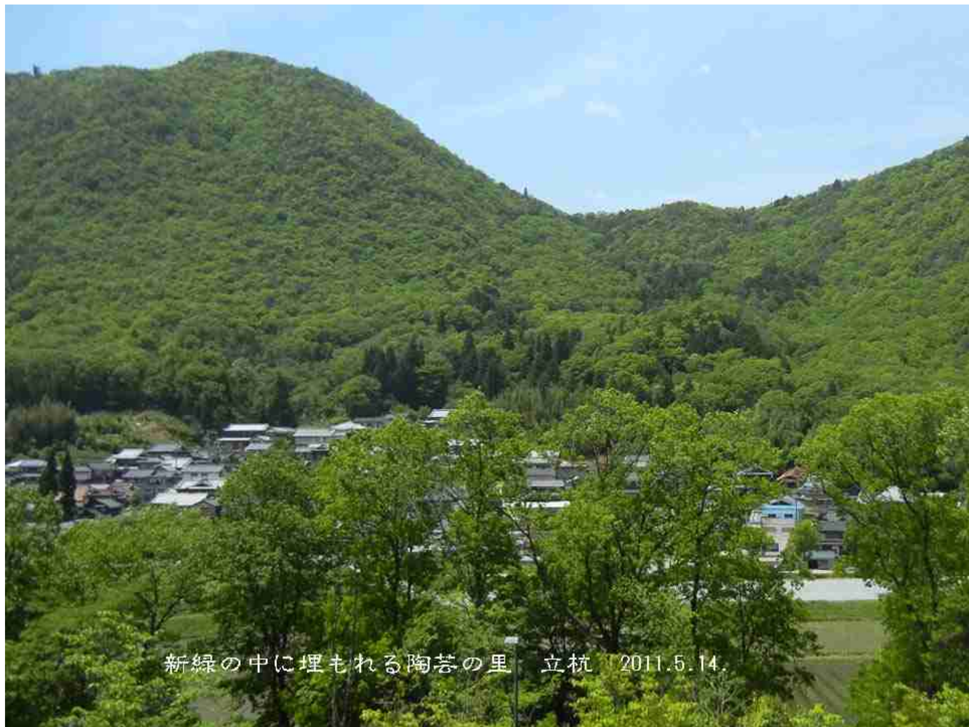
新緑の中に埋もれる陶芸の里 立杭 2011.5.14.