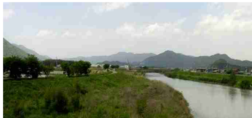
錦橋より南側 分水嶺の南 氷上を北から南へ流れ下る加古川 錦橋より北側 丹波市氷上町稲畑 錦橋で 2011.5.14.