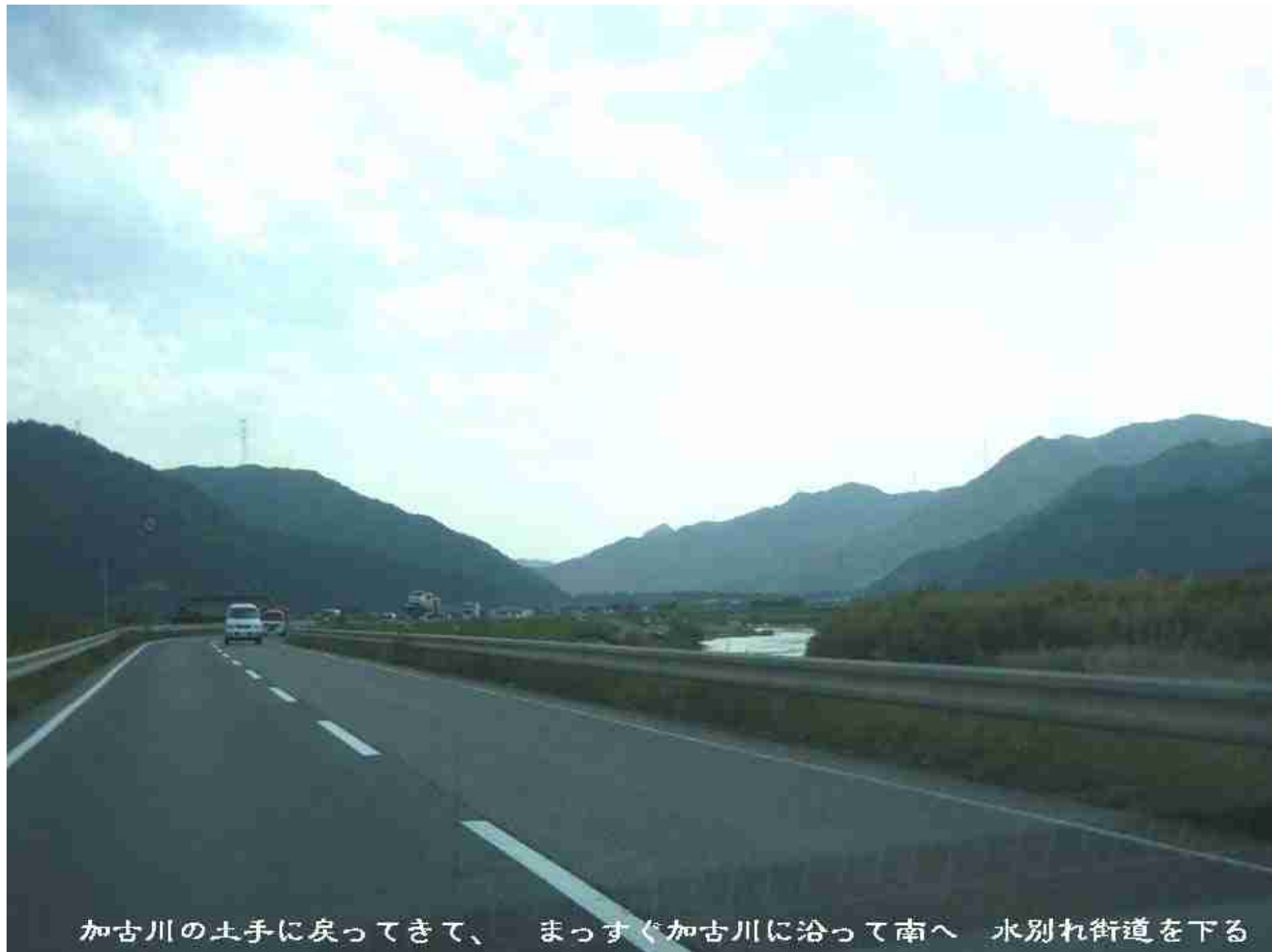
加古川の土手に戻ってきて、 まっすぐ加古川に沿って南へ 水別れ街道を下る