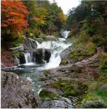
オシドリ隠しの滝