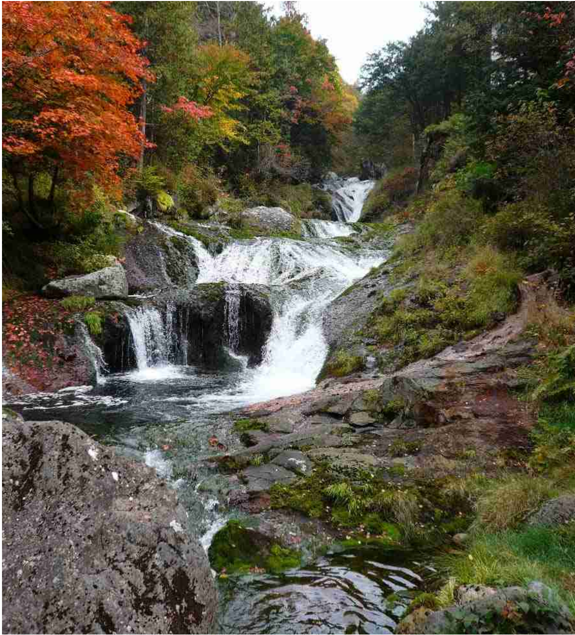
酸性の水質で育つチャツボミゴケが河床を緑に染めて 谷の紅葉と相まって 赤い鉄の谷を一層素晴らしい景観に