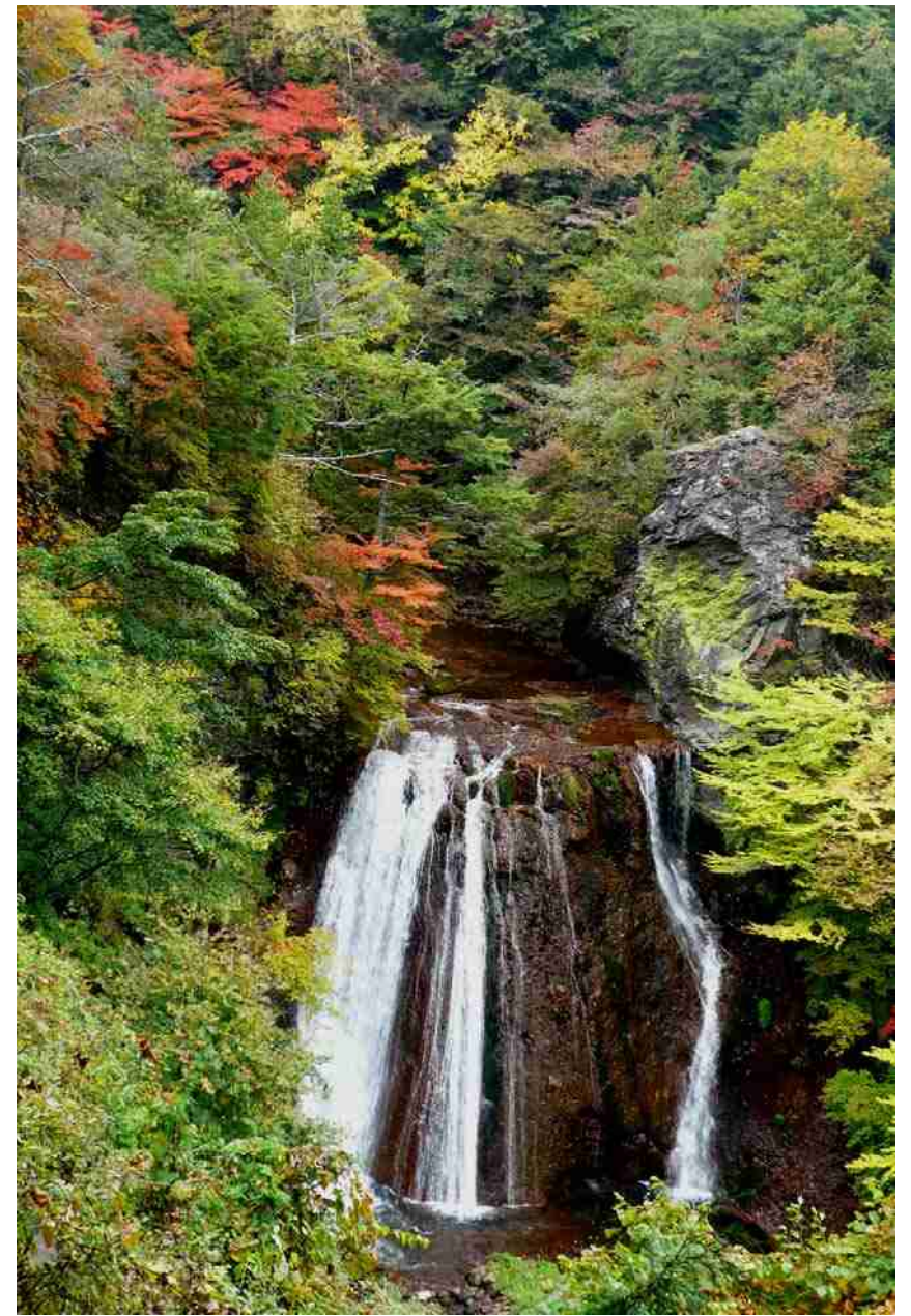
奥蓼科 横谷溪谷で 2010.10.17.