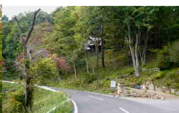
紅葉の中 蓼科中央高原 麦草峠を越えて 諏訪と佐久を結ぶ 国道 299 号線 メルヘン街道は旧諏訪鉄山の鉱区の中を突き進む