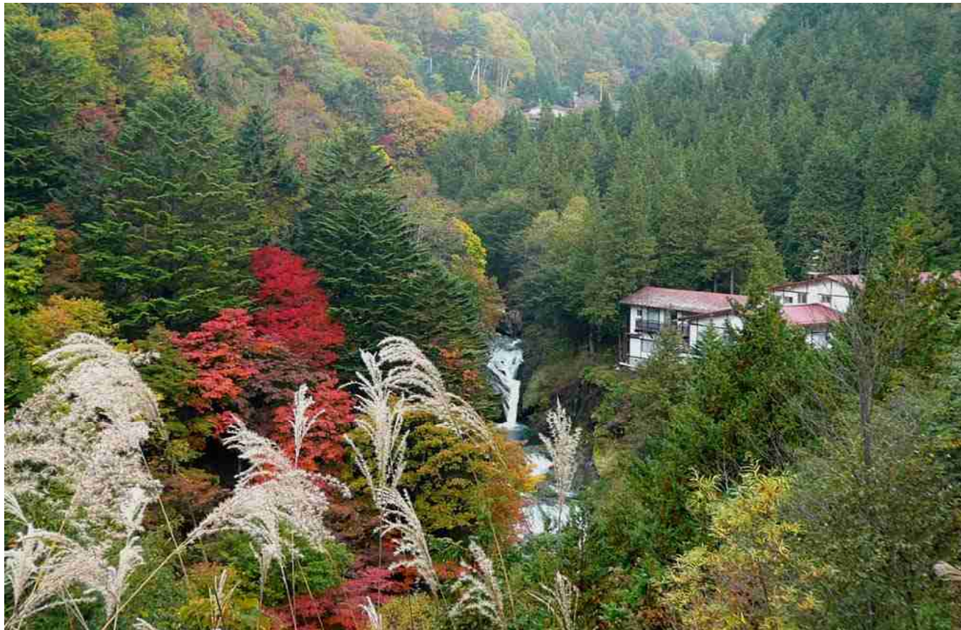
明治温泉の横にかかる「おしどり隠しの滝」遠望 20210. 10. 17.