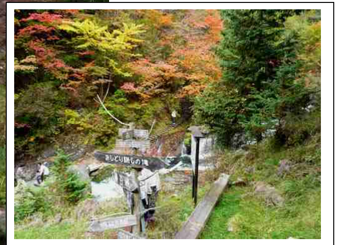
表面が鉄分で赤くなった岩の間を流れ下るオシドリ隠しの滝 岩盤に点々と緑のチャツボミゴケが張り付いている 2010. 10. 17.