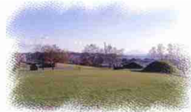
入江・高砂貝塚縄文遺跡

北海道洞爺湖の近く噴火湾を望む海岸の高台にある縄文時代前期から後期(約5000～3500年前)にかけて形成された貝塚・住居・墓を伴う大規模な集落。