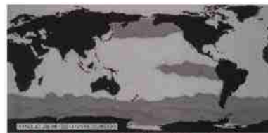
鉄に色づけられた地球の大気中の鉄の分布を示している。HPLC 地球儀

地軸の傾きのふらつき等が地球の氷期と間氷期のサイクルを生むと言われるが、このサイクルの中で 氷期がはじまると 乾燥大地の鉄が大気地ダストとして海に運ばれ、海の植物プランクトンを増加させ、大気中の炭酸ガス濃度を下げ、益々温度を低下させるというモデルが検討されている。