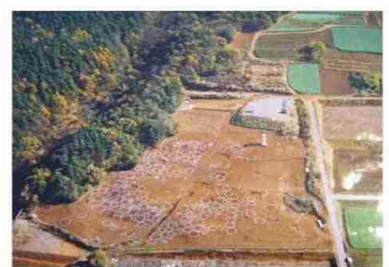
縄文大規模集落遺跡 環状に広がり環状に広がる縄文の集落