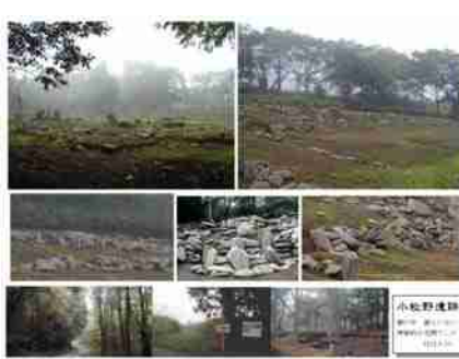
青森 小牧野遺跡のストーン サークル