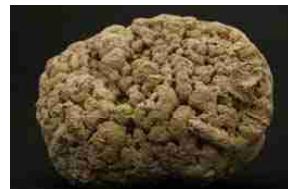
ストロマトライト、シアノバクテリアなどの光合成に伴う分泌物が形成した縞状組織に特徴づけられる炭酸塩岩

約 25 億年前に光のエネルギーを使って 光合成を行うシアノバクテリアが誕生 その光合成に伴う分泌物が形成した縞状組織に特徴づけられる炭酸塩岩。縞状鉄鉱床を形成した大規模な環境変動をもたらした酸素の発生源であると考えられている。(シアノバクテリアが発生させた大量の分子状酸素は海水中の鉄イオンと反応して 海水中の2価の鉄が溶けない3価の鉄になり 沈殿し、大量の鉄鉱床が海底に形成された。なお、原始地球の原始大気、あるいは原始海洋の中で 約40億年前頃生命が誕生したといわれている。)