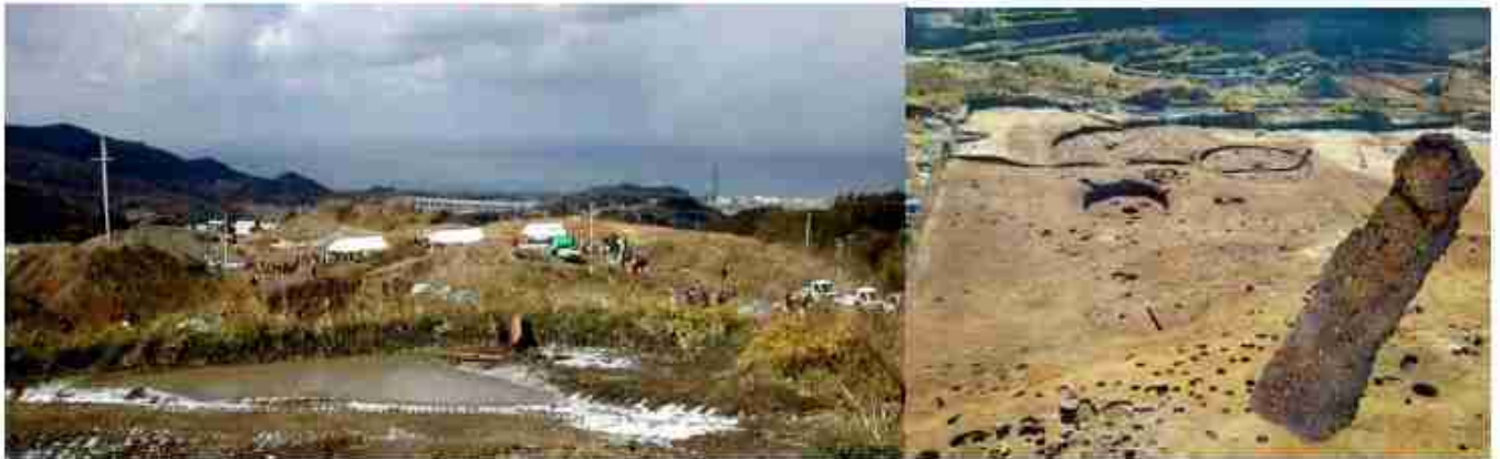
淡路島北部 津名丘陵の播磨灘を眺望する尾根筋にある弥生後期の大鍛冶工房村 五斗長垣内遺跡

弥生時代後期初め AD 20・30年頃からAD200年頃 後期末まで 淡路島北部 津名丘陵の西側 播磨灘を望む海岸から約3km入った 標高200m 播磨灘を見下ろす南北の尾根筋の西面から東西に延びる枝尾根上 南北 約50m 東西約500mの範囲で約170年間継続的に維持された集落遺で、23棟の竪穴住居のうち13棟に鍛冶遺構がある国内最古・最大級の鍛冶工房村遺跡。