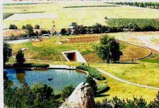
カマン・カレホック遺跡近くが開館した考古学博物館。遺跡を模した丘のようなデザインだ。

中近東文化センターは1985年、トルコ中部のカマン・カレホック遺跡で調査を始め、98年には現地にアナトリア考古学研究所を設立。昨年からビュクリュカレ遺跡で本格的な発掘を始めた。今年7月にはカマン・カレホック考古学博物館が開館し、トルコ政府が招いた報道陣に公開された。日本政府の途上国援助(ODA)を含む総事業費は約5億円。ヒッタイトの謎を長期的に探究する体制が整った。