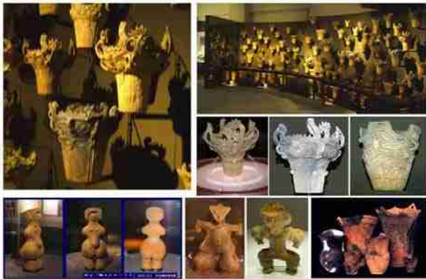
火土器や土偶にみられる渦巻文様

北海道洞爺湖の近く噴火湾を望む海岸の高台にある縄文時代前期から後期(約5000～3500年前)にかけて形成された貝塚・住居・墓を伴う大規模な集落。