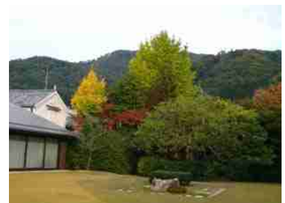
鹿ヶ谷 泉屋博古館 2009. 11. 15.