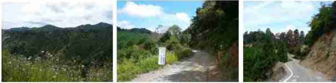
片波林道 伏条台杉〔芦生杉〕群生保護地域 入口周辺 2009.9.14.

谷筋から入って、斜面に沿って尾根筋を登ってゆく片波林道の頂上部近く、林道脇に群生保護地域の案内板があり、これが目印でした。