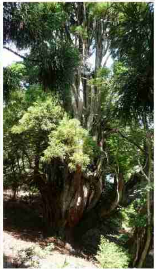
大槽杉 根元周リ 約13m 片波川源流 伏糸台杉〔芦生杉〕群生保護地域で 2009.9.14.