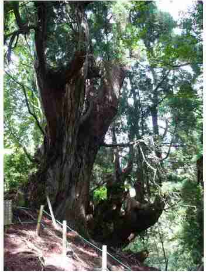
片波川源流 伏杓台杉〔芦生杉〕群生保護地域で 2009.9.14.