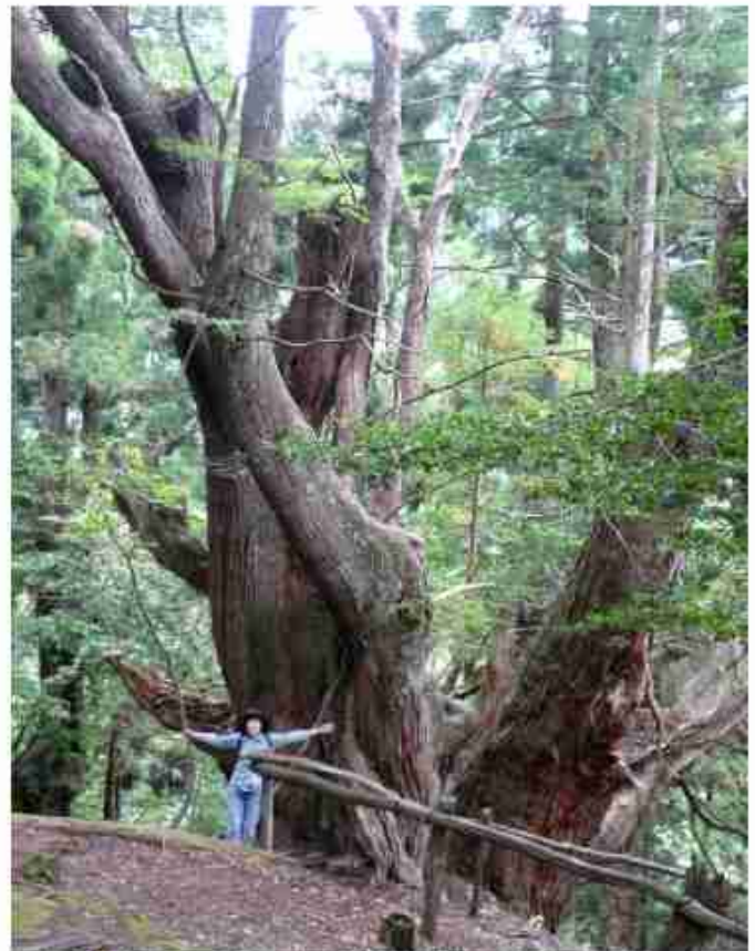
根元周り15.1mの平安杉〔参考 縄文杉は胴回り16m〕