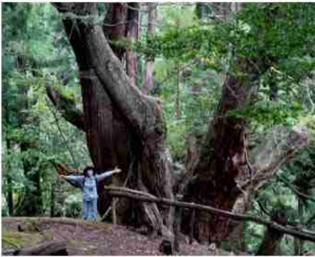
根元周り 15.1m の平安杉【参考 縄文杉は胴回り 16m】

0910kknami00.html 2009.10.5.