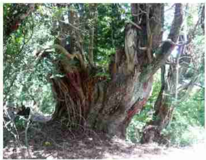
大檜杉 根元周り 約 13m