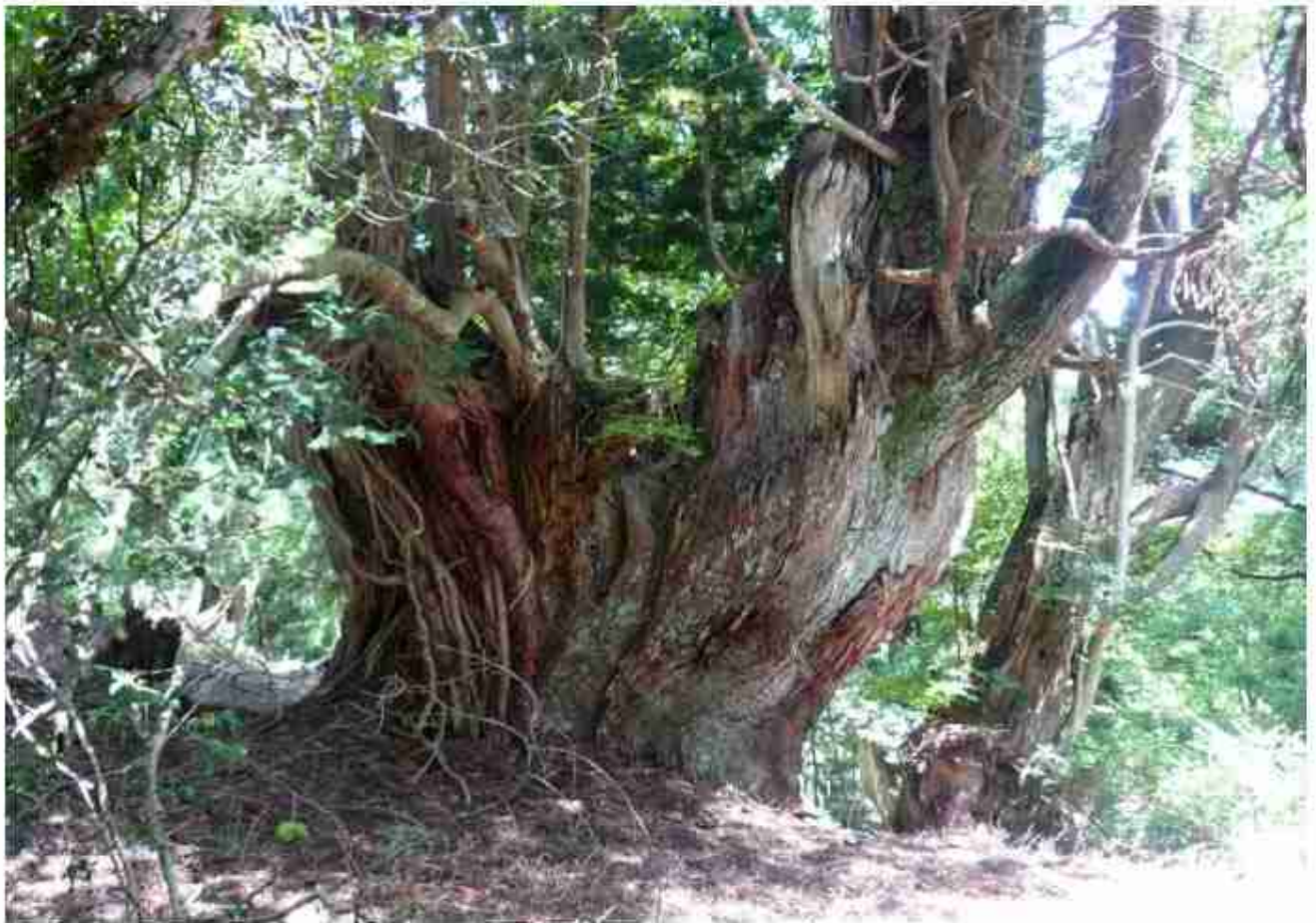
大檜杉 根元周り 約13m 片波川源流 伏杓台杉〔芦生杉〕群生保護地域で 2009.9.14.