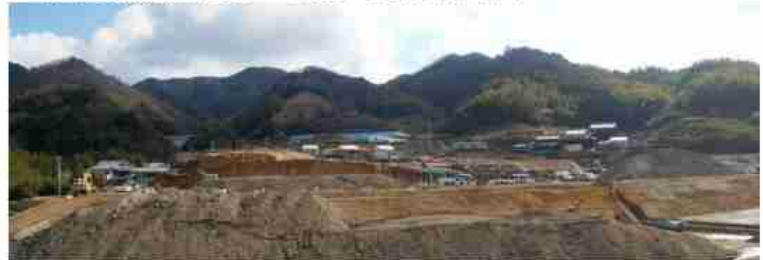
尾根筋の最下部より 尾根筋に広がる遺跡全体 2008.1.25 2007年調査前は既に埋め戻されている