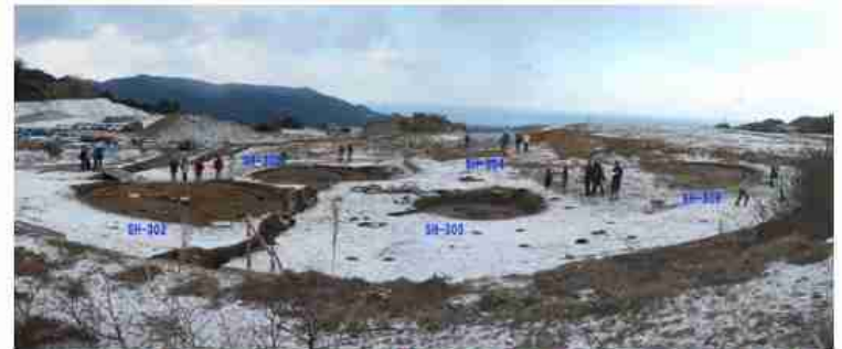
弥生時代後期(1世紀~3世紀前半)の大級鍛冶工房跡「垣内遺跡」主要部 淡路市黒谷 2009.1.25 雪の朝