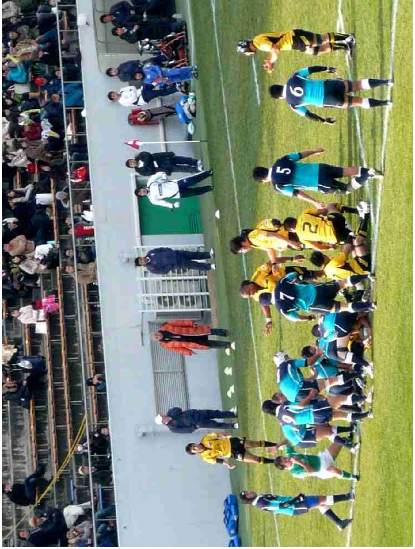
大阪・花園ラグビー場 日本選手権 サントリー／クボタ戦 2009.2.7.