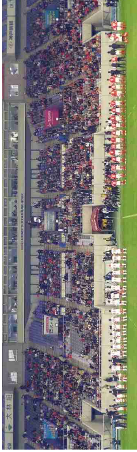
神戸 御崎球場【ホームズ スタジアム】トップリーグ スタイラーズ/三洋戦 12.21.

いつもは、横から流れを見るのですが、ゴールへ向かって走ってくるのを縦から観るのもすごい迫力。また、今年は終了数十秒前 奇跡のドロップゴールによる1点差の劇的な逆転劇を観れました。今年はダメでしたが、来シーズン また、チャレンジです。