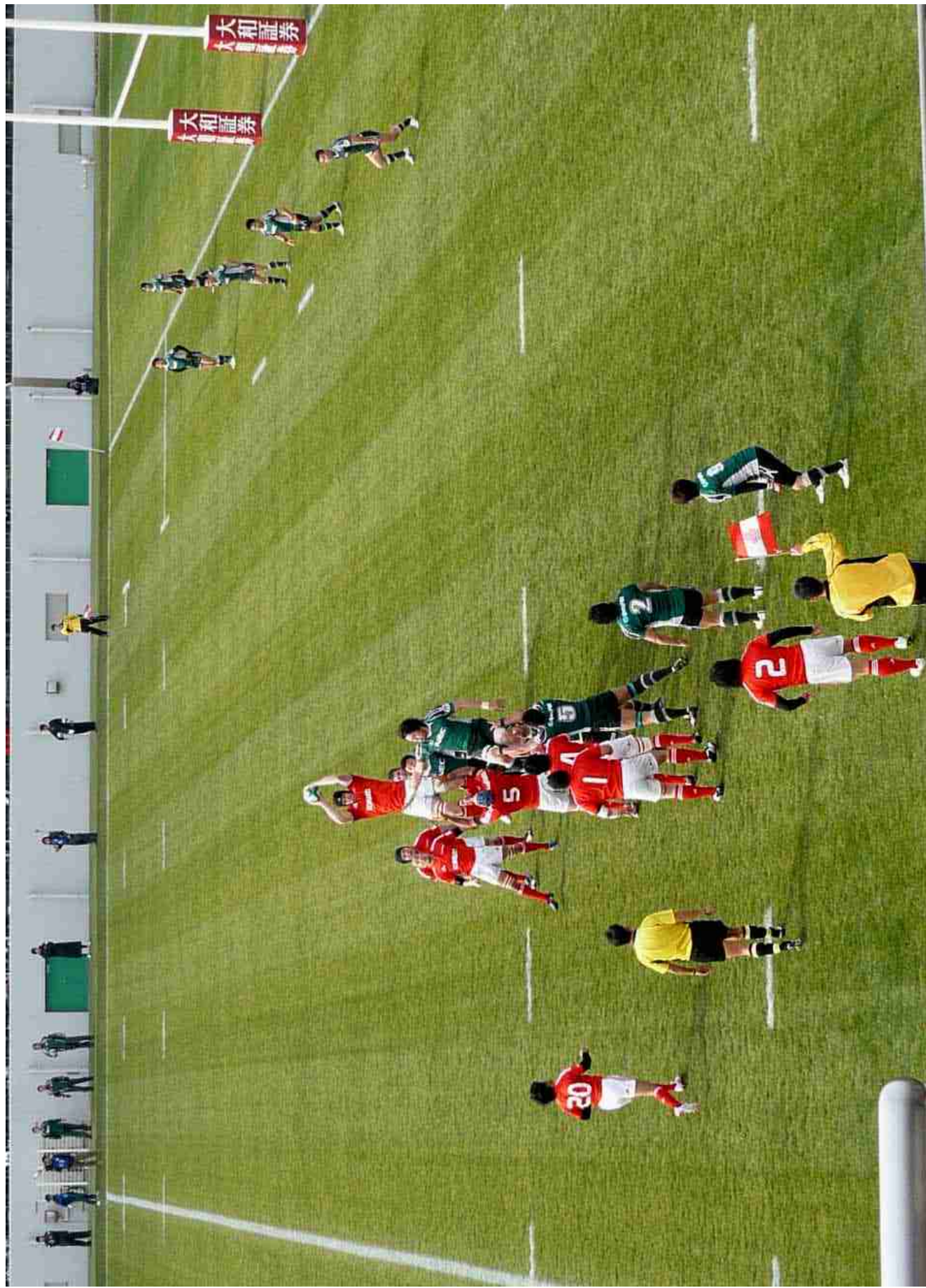
大阪・花園ラグビー場 日本選手権 スタイラーズ/NEC 戦 2009.2.7.