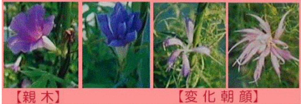
【親木】 変化朝顔 【親株と変化朝顔】 国立歴史民俗博物館資料より

奈良時代に中国から薬草として伝わり、日本人が品種改良を続け、幾つもの種類に育てた朝顔。 その中で、種をつけず一代限りの花の美しさを連続として伝えてきたのが「江戸の変化朝顔」。