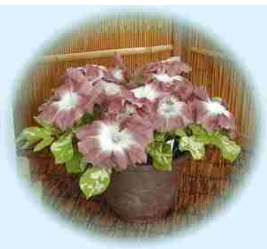
「京朝顔」 京都府立植物園「朝顔展」 2008. 8. 4.