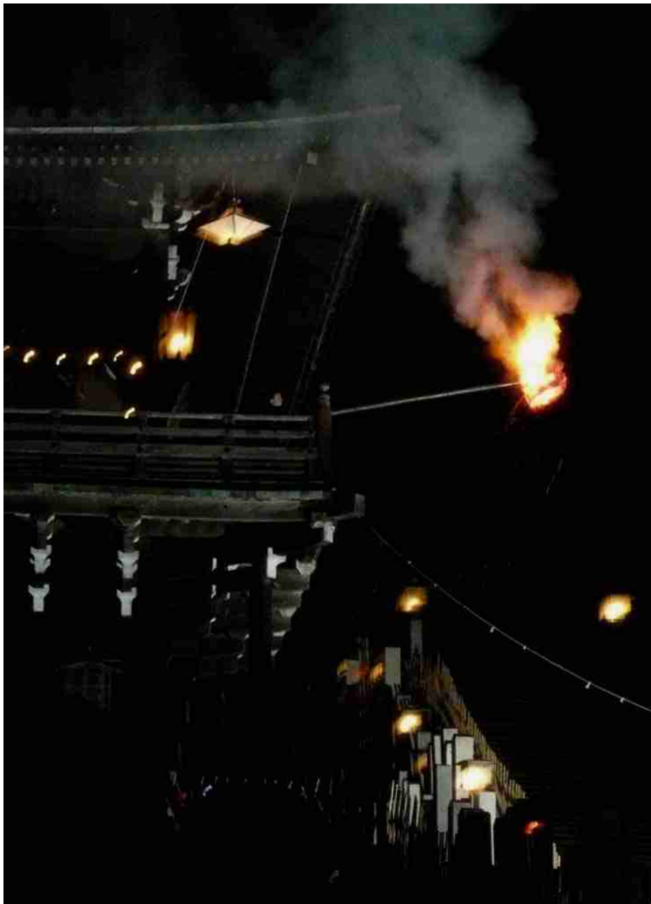
春を迎える風物詩 奈良 東大寺 二月堂のお水取り 2008.3.8.