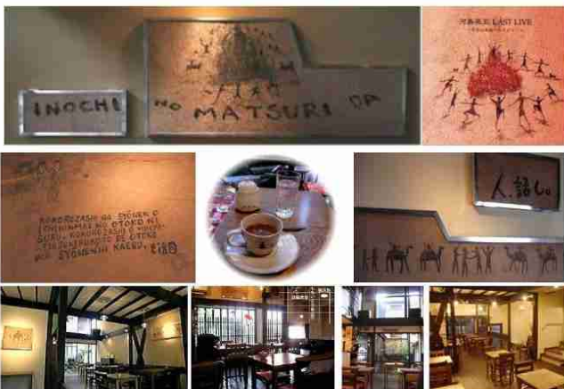
故河島英吾さんのフレーズと絵が壁にさりげなく 喫茶 「TEN, TEN, CAFE」 で 2008.3.8.