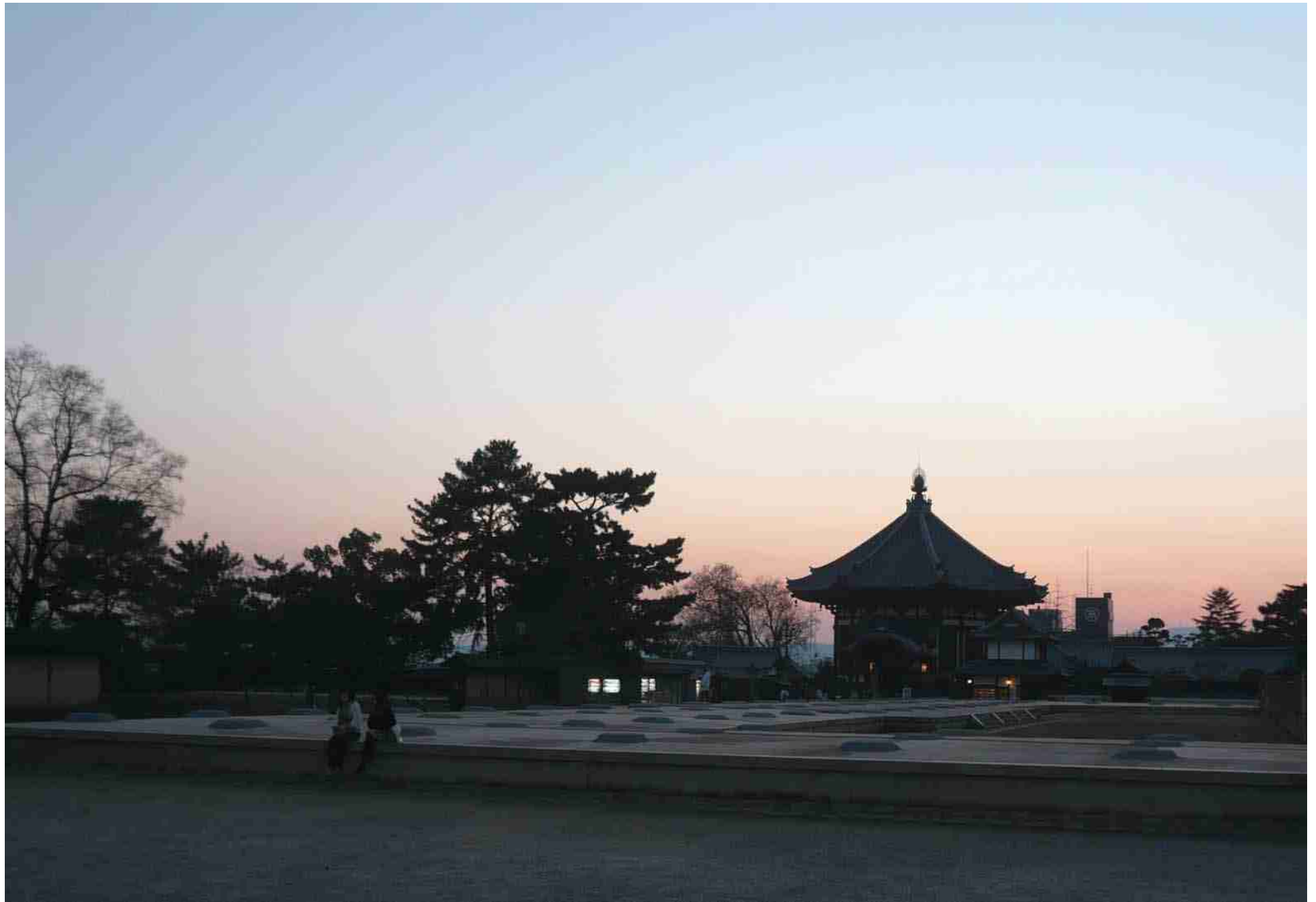
夕暮れの奈良 興福寺 南円堂 2008.3.8.