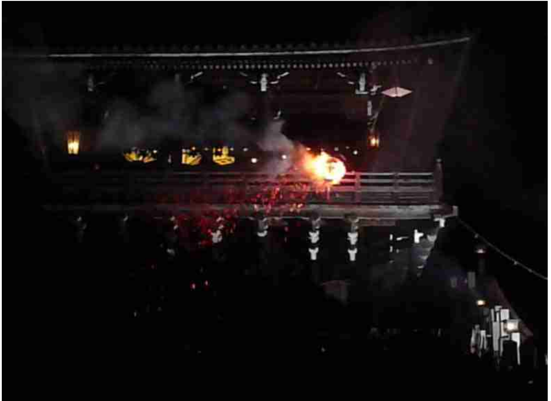
奈良 東大寺の「お水取り」 2008.3.8.