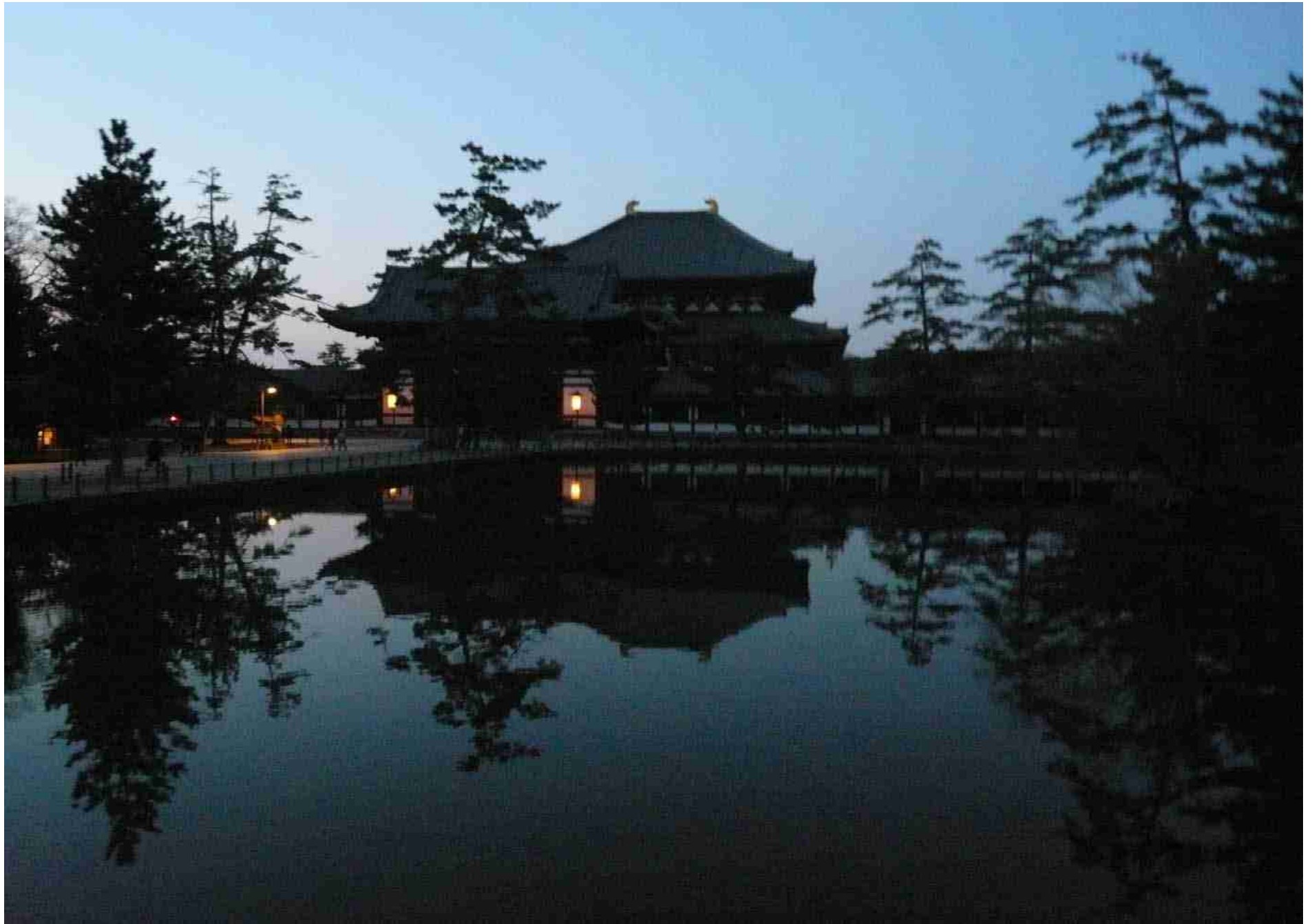
夕闇の東大寺 大仏殿 2008.3.8.