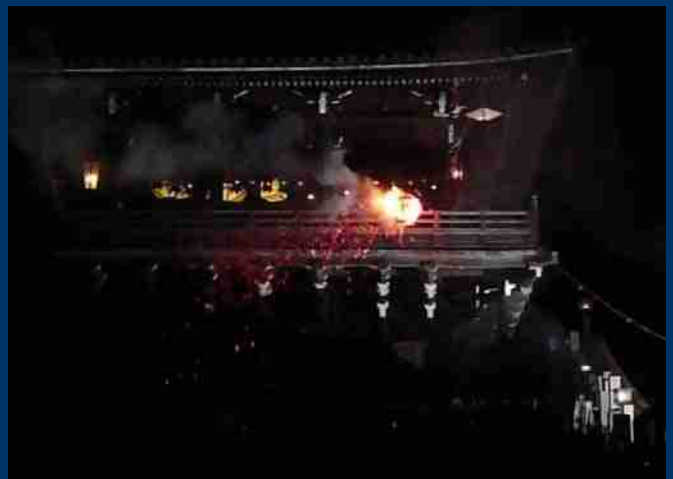
3月8日 奈良 お水取りの季節の夕景