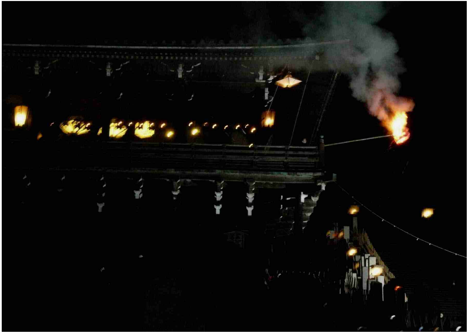
奈良 東大寺の「お水取り」 2008.3.8.