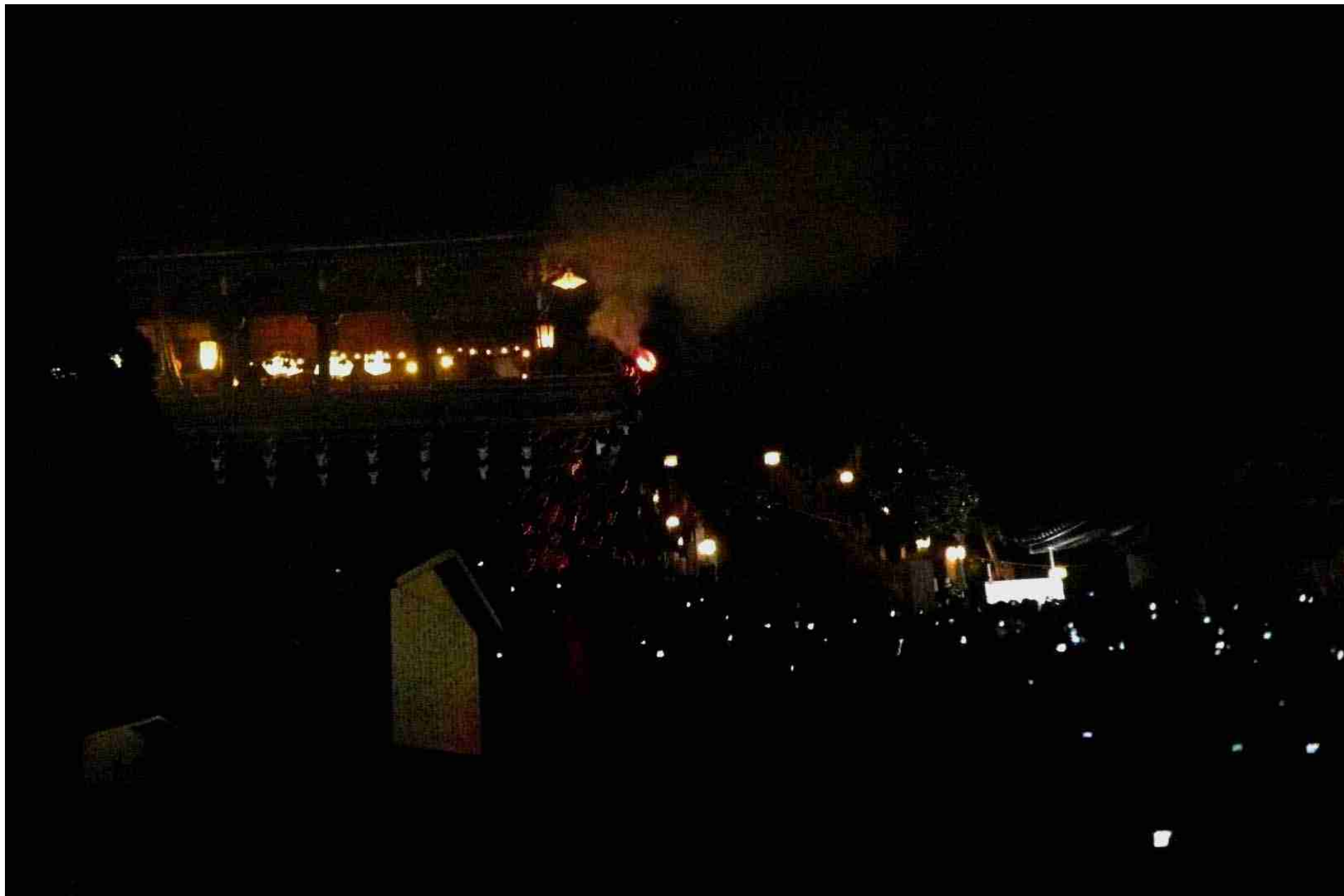
奈良 東大寺の「お水取り」 2008.3.8.