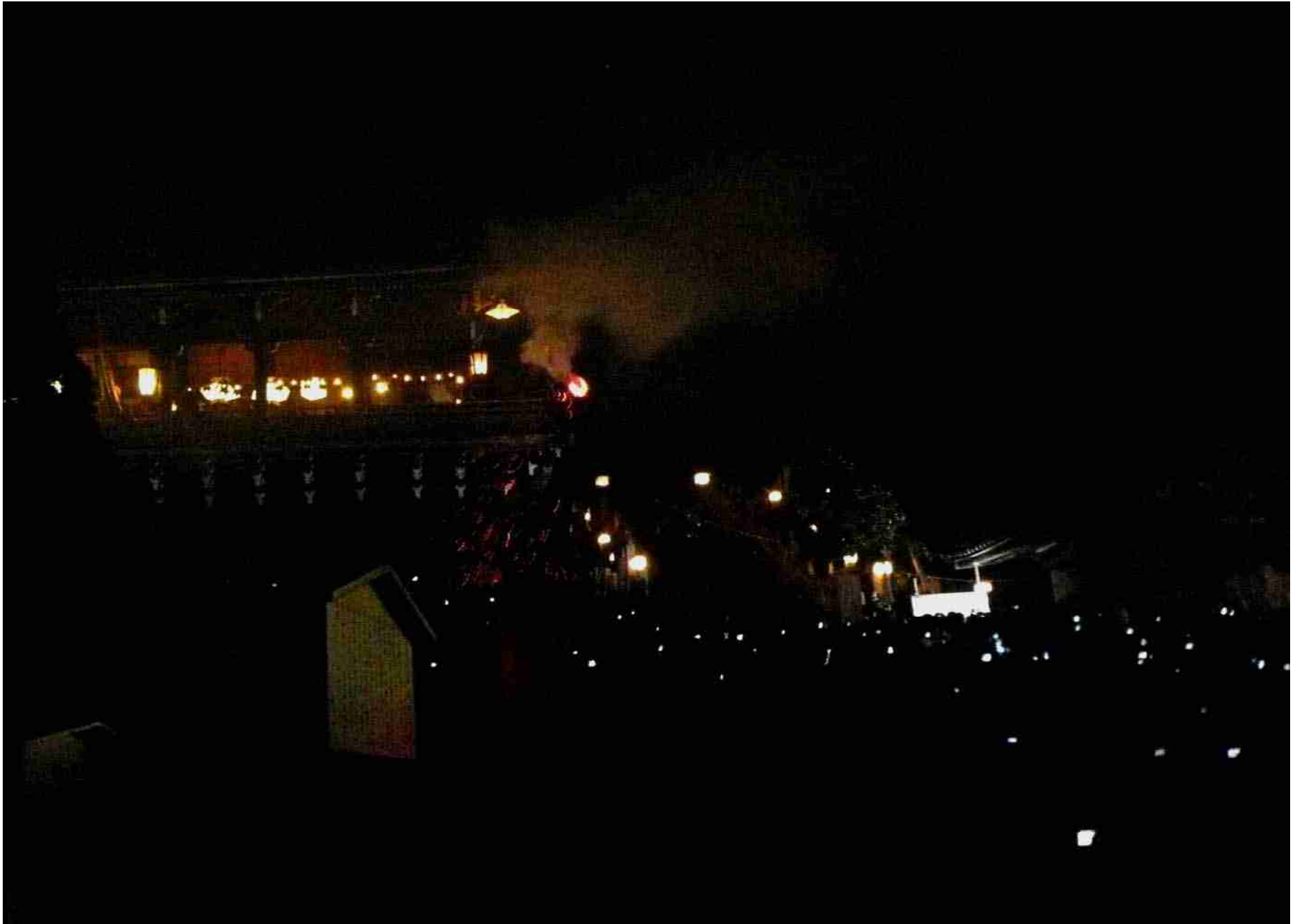
奈良 東大寺の「お水取り」 2008.3.8.