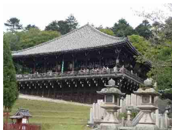
奈良 東大寺 三月堂 夜と昼