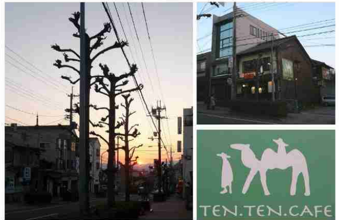
故河島英吾さん縁の店 娘さんがやっておられる喫茶 「TEN, TEN, CAFE」 2008.3.8.