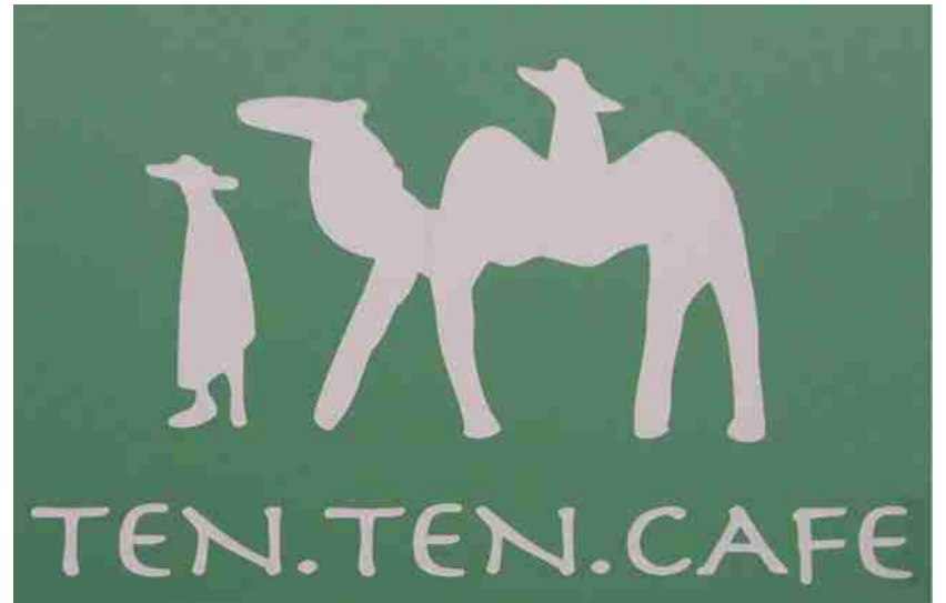
故河島英吾さん縁の店 娘さんがやっておられる喫茶 「TEN.TEN.CAFE」 2008. 3. 8.